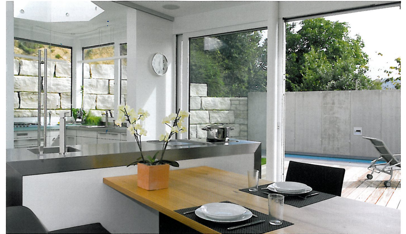
Die große Wohnküche ist seitlich an den Baukörper angeschlossen. Ein skulpturaler Edelstahl-Monoblock mit kleinem Kochfeld inklusive Tepan Yaki und Spüle am Kopfende des Esstisches sowie ein Weinkühlschrank erlauben eine Bewirtung der Gäste quasi direkt am Tisch. Der Clou dabei: Neben der Wohnküche befindet sich eine zusätzliche, voll ausgestattete „Arbeits“-Küche mit Vorratsbereich und Ausgang zum Garten

Tür zur Bangkirai-Terrasse und einem Steingarten mit Blick in die „Hohl“.