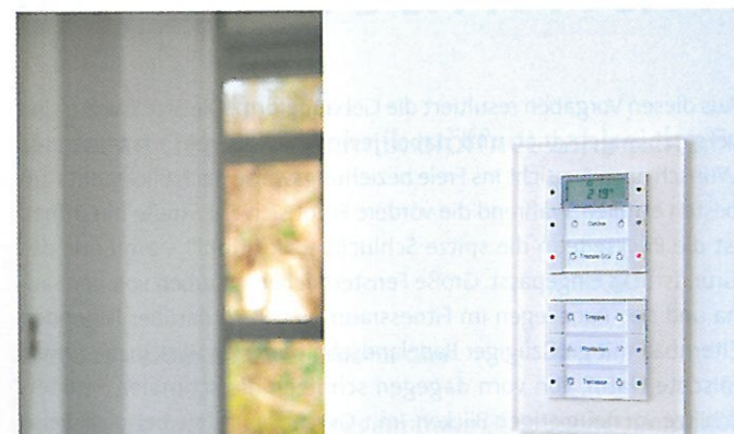
Die moderne Haustechnik lässt sich von Tastsensoren steuern, hier im Schalterrahmen Gira Esprit in weißem Glas.

Über der Garage erhebt sich die großzügig dimensionierte, lichtdurchflutete Eingangshalle mit stützenfreier Glasgarderobe und Gäste-WC, die Bewohner und Besucher willkommen heißt und die durch einen Eingang an der Naturhang-Seite des Gebäudes über einen langgestreckten Sichtbetonsteg betreten wird. Von hier aus gelangt man zur zentralen Treppe sowie zum großzügigen Lift, außerdem in ein Lese- und Fernsehzimmer mit angeschlossenem Bad und