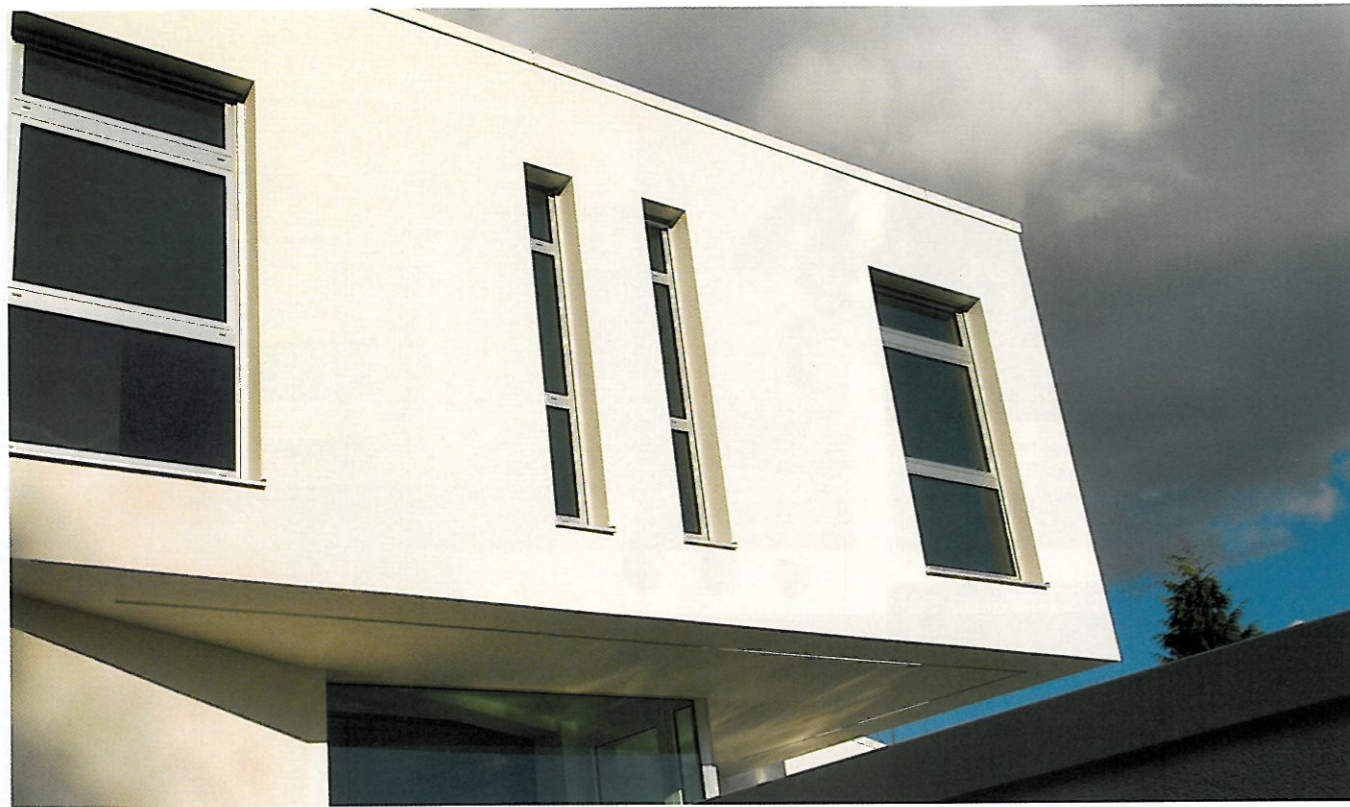
Entstanden ist ein ultramodernes Traumschloss mit vielen einzigartigen Details

Freiheit bestimmt auch das Innere des Gebäudes: Alle drei Stockwerke oberhalb der Garage haben 3 Meter lichte Raumhöhe – die Architektin war durch keinen Bebauungsplan in der Höhenentwicklung des Gebäudes eingeschränkt. Überall finden sich eigens entwickelte, geschosshohe Türen, die garantieren, dass das einfallende Licht nicht durch Türstürze oder Querzargen gebrochen wird – das Licht kann ohne Zensur fortlaufend auf den Decken wandern. Beim Schließen der Türen treten durch einen speziellen Kontakt schallabsorbierende Dichtungen zu Boden und Decke hervor, pressen sich an und verhindern Geräuschübertragungen von Raum zu Raum.